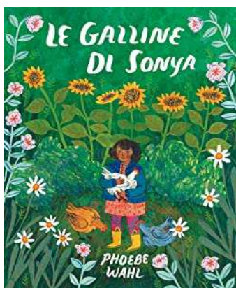
Phoebe Wahl LE GALLINE DI SONYA. Natura e Cultura

Sonya è una bambina che tutti i giorni si prende cura delle sue galline e dei loro morbidi pulcini. Una notte però succede qualcosa di inaspettato e doloroso, che solo le parole attente del suo papà l'aiuteranno a capire. Una storia piccola, calda e piena di colore che racconta la cura, l'empatia e la gioia di guardare il mondo, nel bene e nel male.